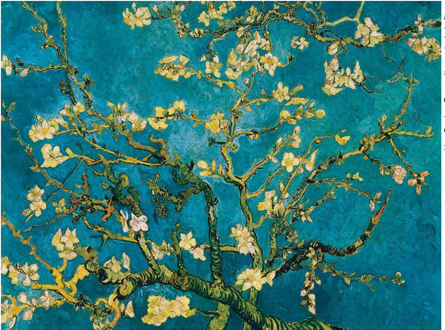
Van Gogh - Ramo di mandorlo in fiore