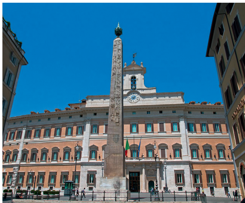
IL PARLAMENTO ITALIANO

F acile dir male di un Governo che governa – tenta – con lo sfavore di tanti. I motivi di questo rivolgimento di giudizio andrebbero esaminati con calma, perché danno la misura dei rapporti di potere. Poteri che poi si preoccupano di aprirci nuove strade politiche: in questi mesi assistiamo all'interessante fenomeno del come ricostruire un'offerta politica da giocare nel momento in cui si spargieranno le carte e si ripartirà senza il leader berlusconiano. Tra i diversi tentativi osserviamo la riapertura di un file che sostava nascosto in un floppy-disk con l'etichetta "partito dei cattolici" o nella variante "terzo polo civico", di responsabilità. L'aspetto positivo è che in quest'operazione nazionale si sollecita la presenza dell'associazionismo dei laici che, di solito, essendo a contatto con la realtà quotidiana, hanno una buona percezione della vita concreta e sono in grado di portare elementi di vita vissuta. Ma questo associazionismo è anche depositario di visioni differenti: si riuscirà a rendere compatibili i pensieri di Cl, Cdo, Focolarini, Azione cattolica, Scout, Sant'Egidio, Cisl, Mcl, Coldiretti, Confcoop e delle Acli? È una bella sfida. Soprattutto perché una proposta politica vive se risponde in modo coerente a domande reali, se incrocia le attese vissute, se è compatibile con lo spirito del tempo, se coglie il sentimento diffuso. Non si tratta di stare insieme nella tempesta: ma di sapere dove andare, leggere i venti e le correnti del mare e poi scegliere