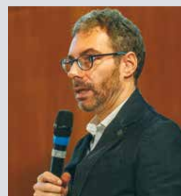
Massimo Alberti. Giornalista esperto di economia e lavoro

Sicurezza. Un lavoratore più precario e più debole, è anche più ricattabile, e meno in grado di far valere i propri diritti. È una situazione che ha conseguenze inevitabili anche nel campo della sicurezza. In Italia ogni giorno muoiono 3 persone di lavoro, ma gli incidenti sono almeno un 30% in più se consideriamo lavoratori e lavoratrici non assicurati Inail o in nero. Siamo abituati a pensare alle morti di lavoro come legate soprattutto a carenze di controlli, assenza di pene severe e di formazione, quasi che il tema della sicurezza fosse "a parte" rispetto al contesto lavorativo. Nel triennio 2022-24 oltre l'80% delle aziende controllate dall'ispettorato presentava violazioni prevenzionistiche, in edilizia il 93%: una sostanziale illegalità di un intero sistema. La prima soglia di controllo però è quella interna. Le associazioni di familiari di vittime del lavoro insistono su un punto: il diritto a rifiutare lavori pericolosi. Il problema è che questo diritto ad oggi è solo sulla carta. E nel contesto economico e culturale che ha spostato potere verso l'impresa, rovesciare sulle spalle del comportamento del singolo la responsabilità della propria sicurezza, rischia dunque di essere solo un esercizio retorico in contesti di precarietà, deregolamentazione, assenza di diritti. Non a caso negli ultimi anni sono cresciute le vertenze giuridiche che coinvolgono i rappre-