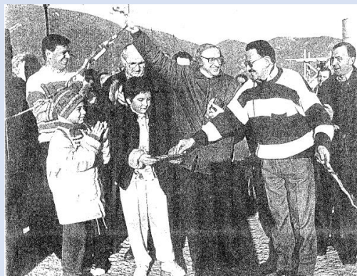
29 gennaio 1994 – Inaugurazione dei locali del circolo ACLI