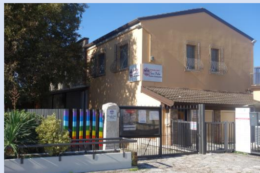
2023 – Il circolo ACLI oggi dopo 30 anni