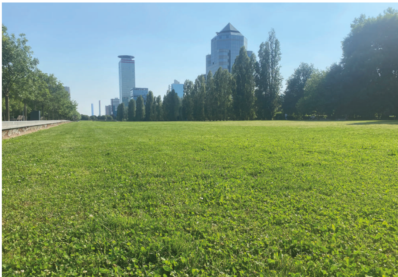
Il parco Tarello a Brescia

Tutti questi benefici ovviamente hanno un costo. Prescindendo dalle spese in conto capitale eventualmente legate all'acquisizione pubblica delle aree da destinare a verde urbano, garantire accessibilità e funzionalità a un significativo patrimonio verde richiede l'appostamento di risorse correnti di consistente entità. Il costo per la manutenzione del verde pubblico varia notevolmente in base alle attività; il solo sfalcio dell'erba oggi costa almeno 0,11€/mq, ma più spesso arriva a cifre ben superiori, mentre la gestione professionale privata si aggira tra 2€ e 5€/mq.